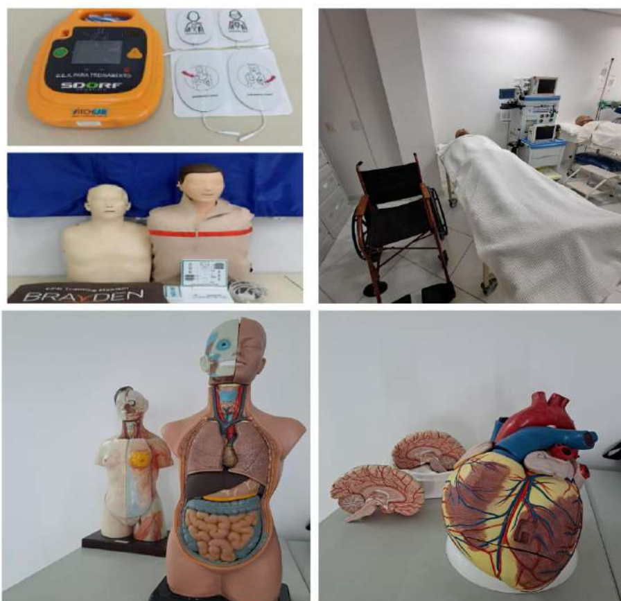
Figuras: 3, 4, 5, 6, 7 e 8 – Laboratório de Enfermagem

Para as disciplinas de primeiros socorros e suporte básico e avançado de vida, por exemplo, nosso laboratório conta com manequins de média performance de treinamento de RCP (reanimação cardiopulmonar) com led vermelho e display eletrônico que permite a visualização de efeitos e benefícios de uma manobra de qualidade, onde as luzes e áudios indicam a profundidade e a frequência ideal de movimentos. Está disponível ainda, um simulador de DEA (desfibrilador externo automático) com controle remoto para treinamento em suporte básico e avançado à vida, simulando cenários passíveis ou não de choque.