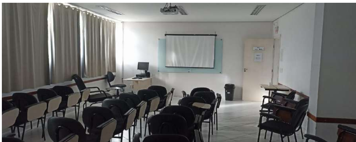
Figuras: 1 e 2 – Salas de aula