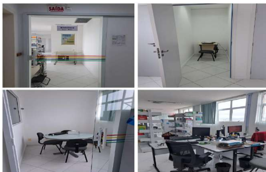
Figuras: 14, 15, 16, 17 e 18 – Biblioteca da Escola de Saúde Pública de Santa Catarina

A biblioteca da ESPSC, apresenta um acervo com cerca de 4.000 exemplares especializados em saúde, compreende livros, periódicos, folhetos, monografias e material multimídia. Possui ambiente para estudos em grupo e individual, com três salas individuais equipadas com notebooks e acesso à internet para pesquisas em bases de dados. É disponibilizado aos usuários da biblioteca um computador exclusivo para consultas.