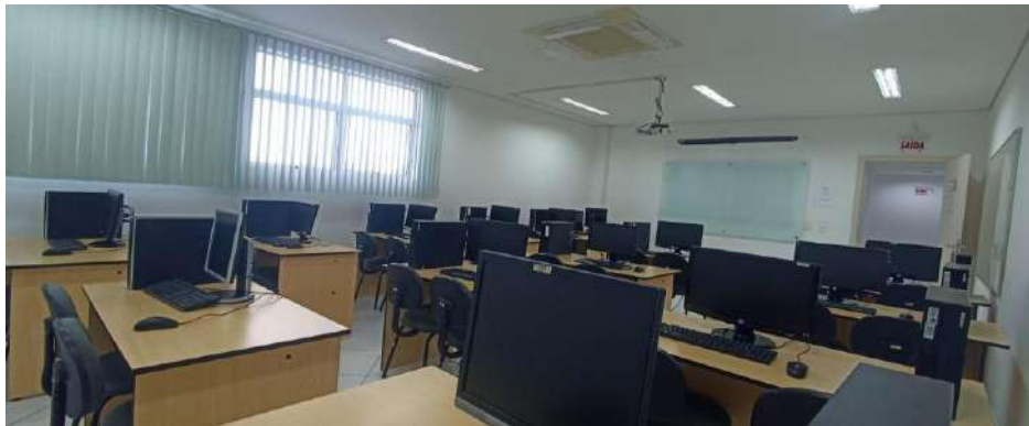
Figuras: 12 e 13 – Sala de informática

No contexto da educação na saúde, o laboratório de informática é um importante espaço pedagógico de apoio aos discentes possibilitando o desenvolvimento de competências relacionadas ao uso da tecnologia de forma ética, eficiente e segura. O ambiente é equipado com 14 computadores com acesso à internet, com capacidade para 27 pessoas, além de projetor multimídia e sistema de climatização, favorecendo a realização de atividades teórico-práticas e o acesso a recursos digitais que complementam o processo de ensino-aprendizagem.